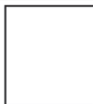
format w nekrologu wspomnieniowym