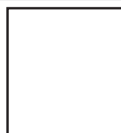
format w nekrologu wspomnieniowym